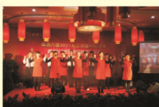
职工迎新春联欢会