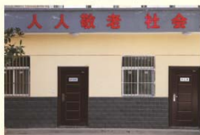
新建的离退休职工活动中心