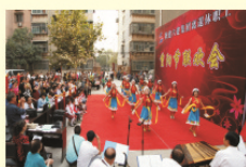
离退休职工重阳节联欢会