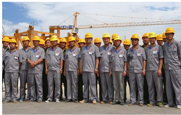
团结奋进的项目管理团队