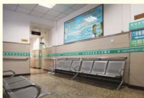
装修一新的职工医院