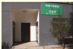
新建的家属院卫生所