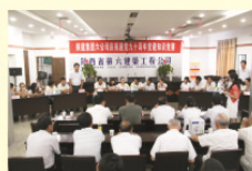
党建知识答题活动