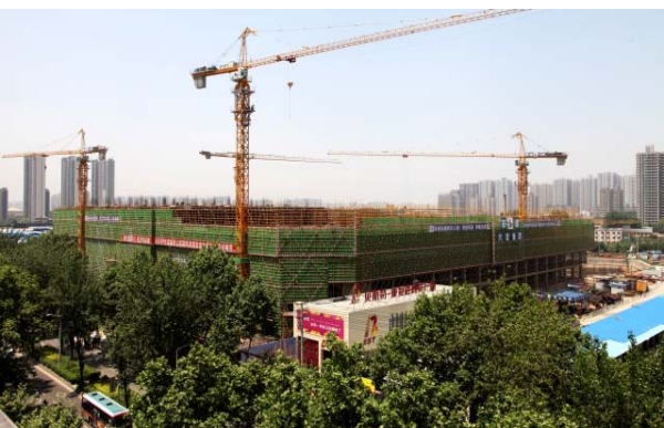
建设中的贝斯特康复路商贸广场B区工程

友，占一片市场”的经营策略，科学组织施工，严控工程质量，实施技术创新，确保工程进度，先后被评为陕西省文明工地、陕西省建筑优质结构、陕西省建筑业绿色施工示范工程，并于今年8月份举办了西安市城改项目观摩会，得到建设单位、监理单位和社会各界一致好评。