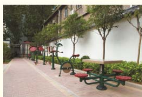
环境优美 设施齐全的家属院