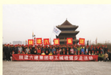
职工城墙徒步走活动