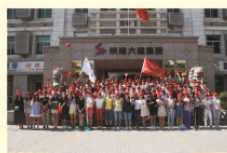
青年志愿者服务队