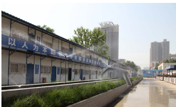
办公区自动喷淋降尘系统