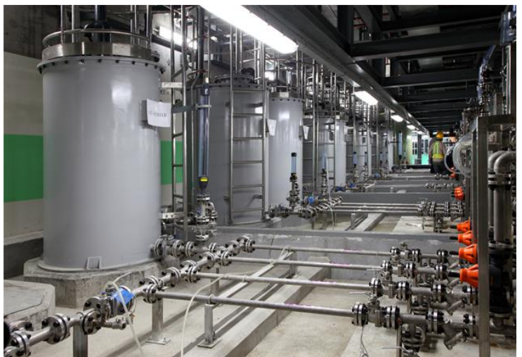
三星封装项目污水处理厂内部机电安装

在工程施工中，项目部不仅要抢抓工期，同时还要兼顾韩方规范和中国GB标准，而且图纸大多数为英文及韩文并随施工进度出图，工程管理难度大，施工质量要求高。项目部人员不畏困难，将施工过程作为自身学习和提高的过程，与韩方积极配合，及时沟通，解决了施工中的难题，保质保量按时完成了施工任务。其中，安全管理高于国内标准，大体积钢筋混泥土水池蓄水后无渗漏，机电设备安装速度超越了三星其他已建成项目，设备及工艺管道的运行参数达到韩方施工书的要求，工程质量得到了韩方的高度认可和好评。