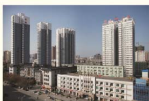
新建的职工高层住宅楼