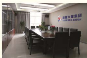
新建的集团办公西区