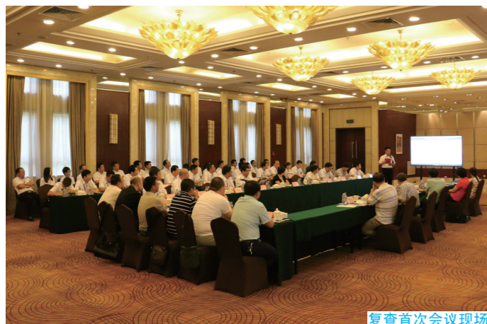
复查首次会议现场