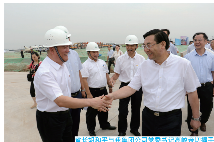
省长胡和平与我集团公司党委书记高峻亲切握手

9月12日上午，在参加完咸阳G8.6代液晶基板玻璃生产线项目动员会后，省长胡和平、副省长姜峰等一行来到我集团公司彩虹光电工程项目部视察，了解工程情况。