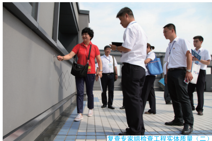
复查专家组检查工程实体质量（二）