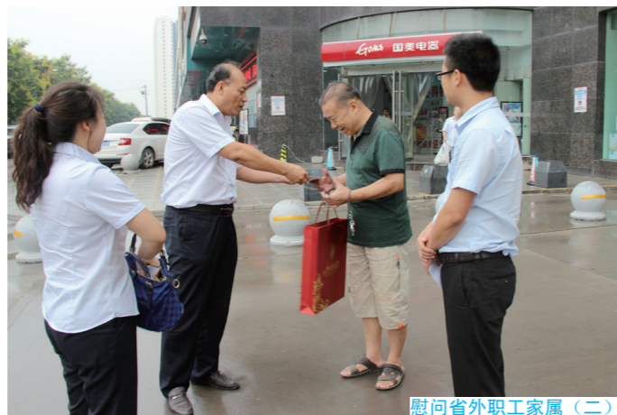
慰问省外职工家属（二）