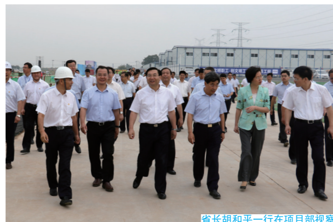
省长胡和平一行在项目部视察