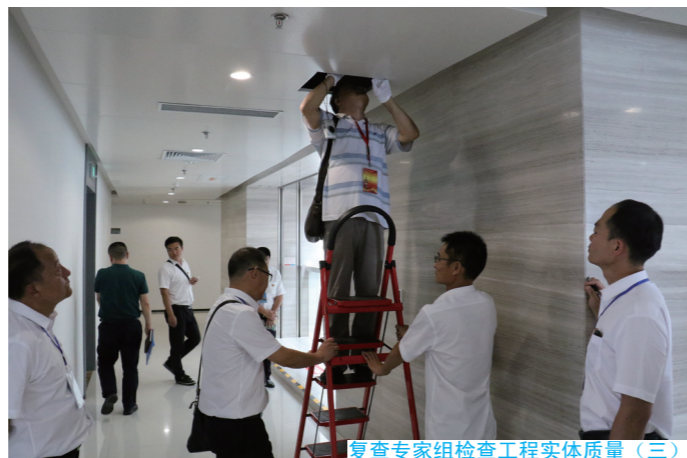
复查专家组检查工程实体质量（三）

8月31日至9月1日，2016—2017年度第一批中国建设工程鲁班奖（国家优质工程）复查专家组对我集团公司承建的沔西新城总部经济园综合楼工程进行了为期两天的复查验收。