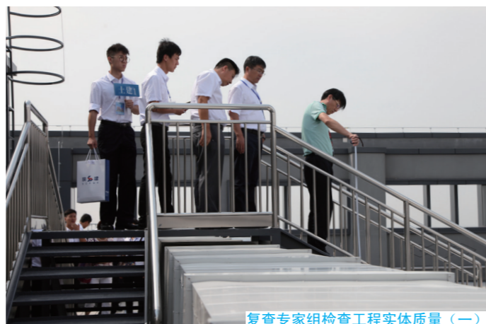
复查专家组检查工程实体质量（一）