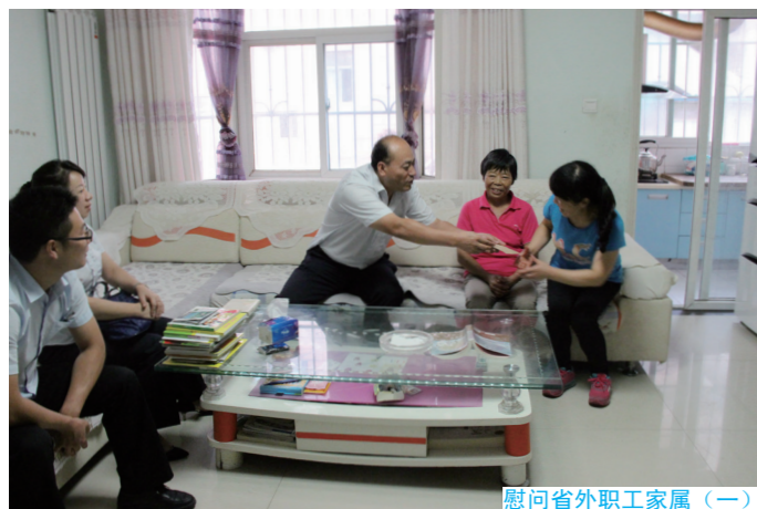
慰问省外职工家属（一）

近年来，集团公司坚持“立足陕西、辐射西北、面向全国、开拓海外”的战略思路，围绕市场布局，累计成立了北至内蒙、南至海南、东至浙江、西至新疆等24个省外公司，共有62名职工远离家人奋战在省外各经营和施工一线，为企业“开疆拓土”做着积极的贡献。今年1至8月份，集团公司省外累计承接任务24.37亿元，同比增长22.89%，占集团公司总承接任务的30.42%，省外市场布局日趋合理。（张瀚予）