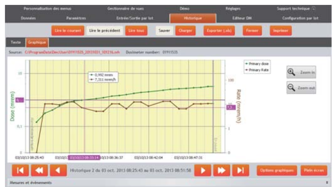
剂量测量历史曲线图

› 上海富蓝机电设备有限公司 上海市江场三路88号801室, 200436 电话: 021-66315361 传真: 021-66528796